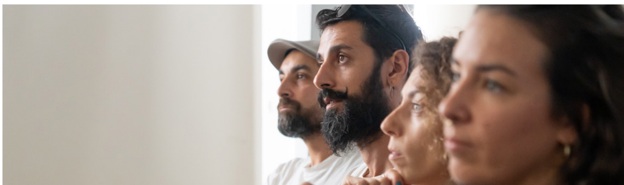
Públic assistent a la jornada.

“Per escriure una poesia que no sigui política, he d'escoltar els ocells. Però, per escoltar els ocells, fa falta que cessi el bombardeig”