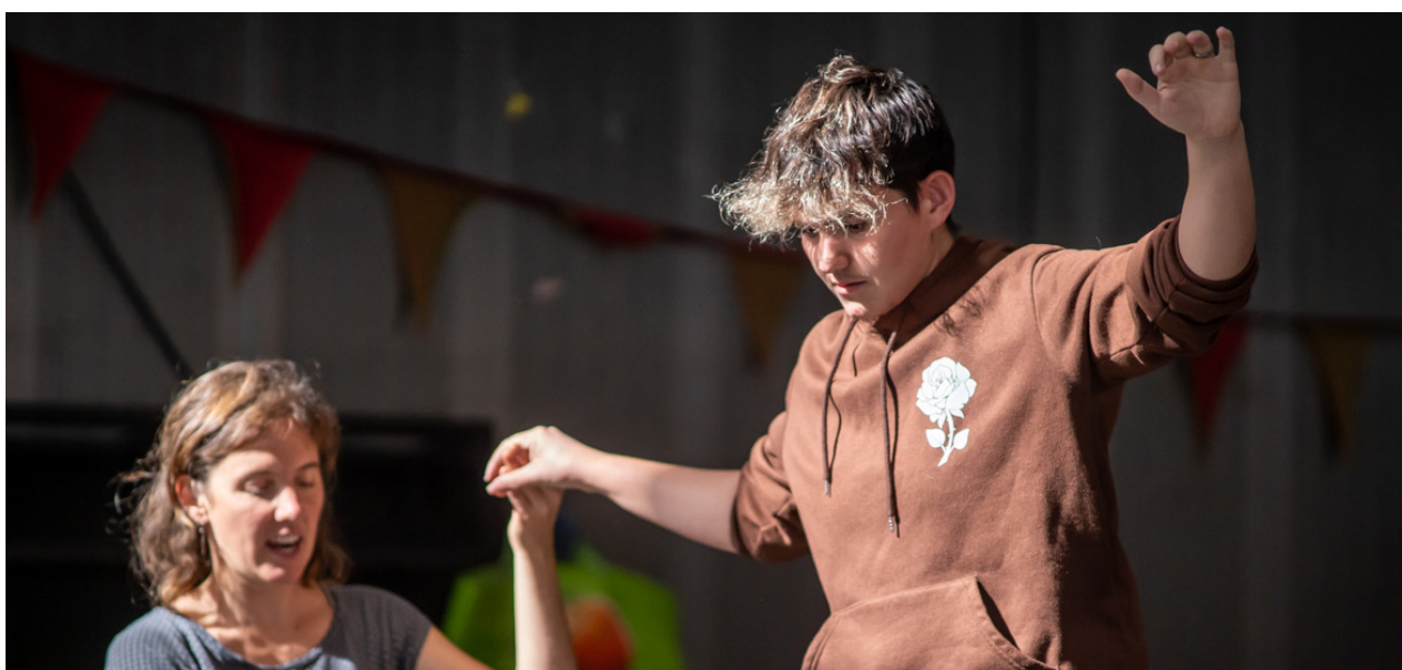
Taller d'equilibris.

Finalment, Vidal-Ribas destaca que l'objectiu de les jornades és empènyer el circ social. El millor indicador per poder valorar si s'assoleix aquest objectiu vindrà de saber quants projectes nous s'han generat arran d'aquestes trobades. Per això, demana que si alguna de les organitzacions activa alguna iniciativa, ho faci saber a l'Ateneu Popular 9 Barris: "Si d'aquí a tres mesos, un any o tres anys passa alguna cosa, estarem contentes que ens ho comuniquem, perquè aquesta és la motivació que fa que la jornada es dugui a terme".