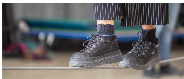
Participants de la jornada fent tallers de circ.